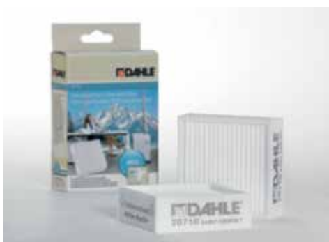
Drobne filtry cząstek stałych Dahle 20170