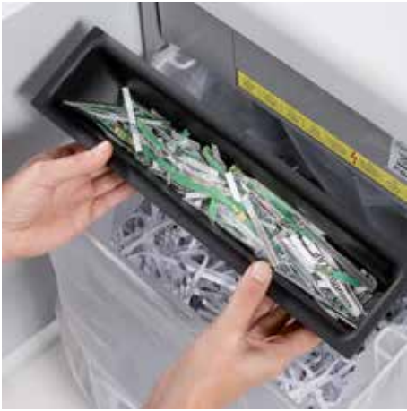
Samostatná, integrovaná sběrná nádoba podporuje ekologické třídění papíru a CD, DVD a kreditních karet