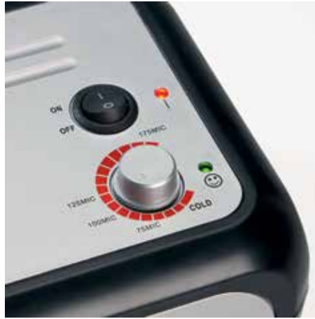
Individuelle Temperatureinstellung für ein perfektes Ergebnis