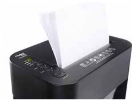
Dahle Aktenvernichter ShredMATIC 35080 - Manuelle Papiereingabe bis zu 8 Blatt 80 g/m 2