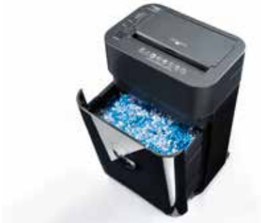
Dahle Aktenvernichter ShredMATIC 35080 - Integrierter Auffangbehälter