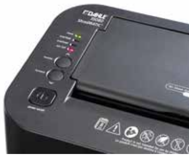
Dahle Aktenvernichter ShredMATIC 35080 - Übersichtliches Bedienfeld