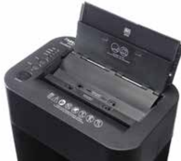
Dahle Aktenvernichter ShredMATIC 35080 - Komfortable Papierzufuhr bei Nutzung der Auto-feed-Funktion