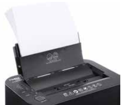
Dahle Aktenvernichter ShredMATIC 35080 - Praktische Stapelverarbeitung bis zu 80 Blatt 80 g/m 2