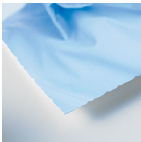
Nepravidelná řezná hrana ke zpracování okraje papíru