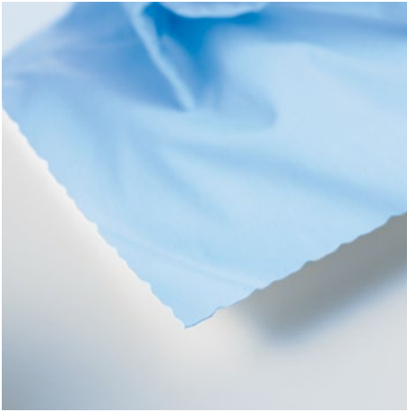
Büthen-Schnittkante zur Papierveredelung