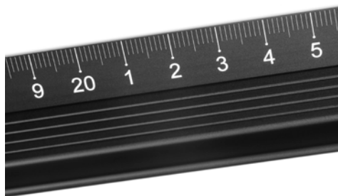
Règle de coupe Dahle 10683 - Division en centimètre pour des coupes de haute précision