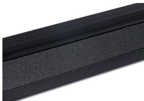
Règle de coupe Dahle 10683 - Large support antidérapant sur le dessous maintenant la règle bien en place