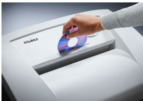
Niszczarka dokumentów Dahle Waste 110