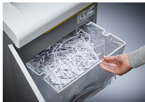
Niszczarka dokumentów Dahle Waste 110