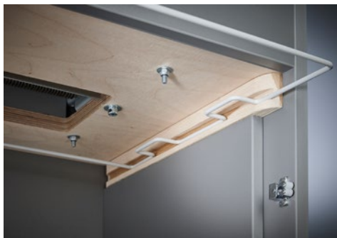
Niszczarka dokumentów Dahle Waste 110