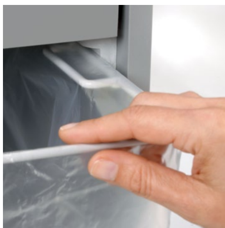
Wyciągnij zaokrągloną górną ramkę kiedy wymieniasz worek na ścinki