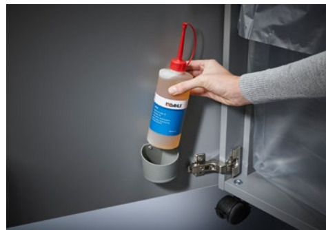
Niszczarka dokumentów Dahle Top Secret 616