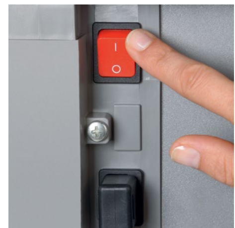
Oddzielny główny wyłącznik jest ulokowany w tylnej części niszcarki i całkowicie odcina ją od prądu