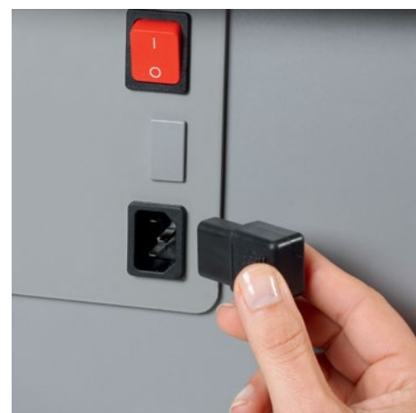
Wymowana wtyczka zasilania sprawia że łatwo przenieść niszcarkę z punktu A do punktu B