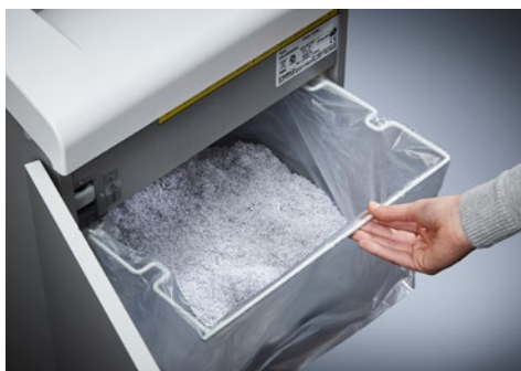
Niszczarka dokumentów Dahle Top Secret 616