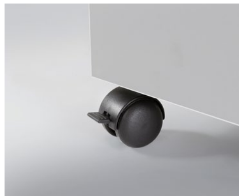
Roulettes directionnelles pratiques pour une utilisation flexible