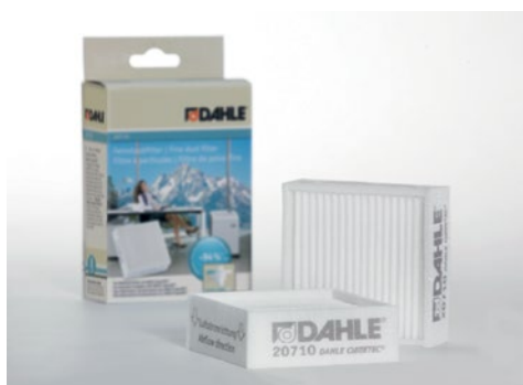
Fines filtres à particules Dahle 20710