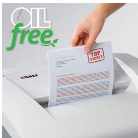
Détruire agréablement des documents sans aucun huilage des rouleaux de coupe prenant du temps