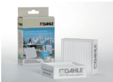
Drobné filtry částek staých Dahle 20170