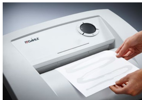
Dahle skartovač Waste 210air