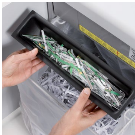
Samostatná, integrovaná sběrná nádoba podporuje ekologické třídění papíru a CD, DVD a kreditních karet