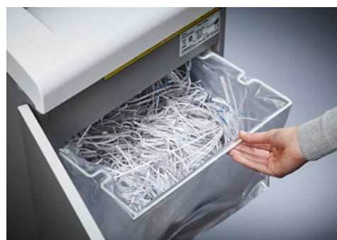
Dahle skartovač Waste 210air