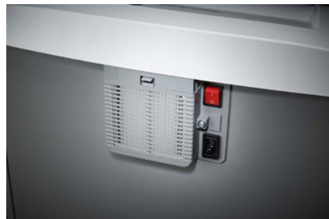
Niszczarka dokumentów Dahle Top Secret 710air