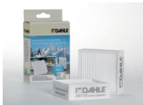
Filtr mikropyłków Dahle 20710