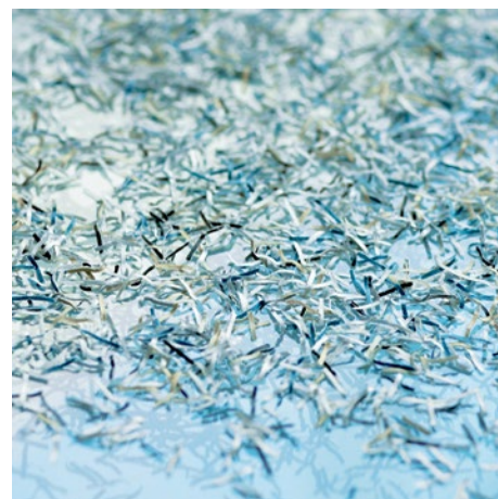
Stupeň utajení P-6: Doporučuje se pro datové nosiče s tajnými údaji, jestliže musí být zachována mimořádně vysoká bezpečnostní opatření