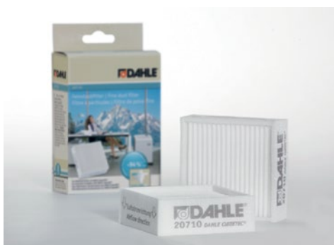
Drobné filtry častek stałych Dahle 20710