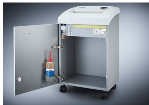
Dahle skartovač Security 504air