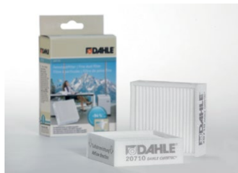
Drobné filtry částek stałych Dahle 20170