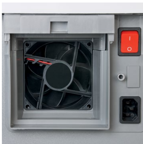
Výkonný ventilátor nasává drobnou částice prachu uvnitř skartovače a odvádí je k filtru