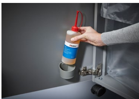
Dahle skartovač Security 504air