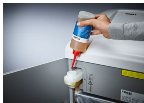
Dahle skartovač Security 504air