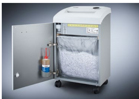
Dahle skartovač Security 504air