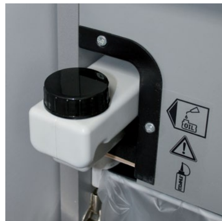
Integrovaná olejová nádrž pro pravidelné, automatické mazání řezných válců cross-cut olejem prodlužuje dobu běhu při konstantním výkonu