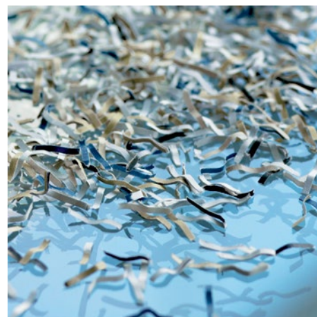
Stupeň utajení P-5: Doporučuje se pro datové nosiče s tajnými údaji