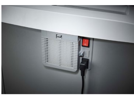
Dahle skartovač Security 504air