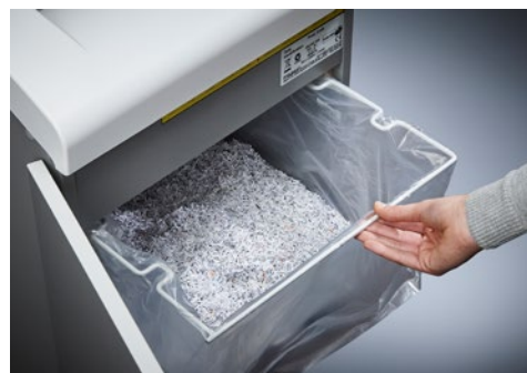
Niszczarka dokumentów Dahle Security 510 L plus