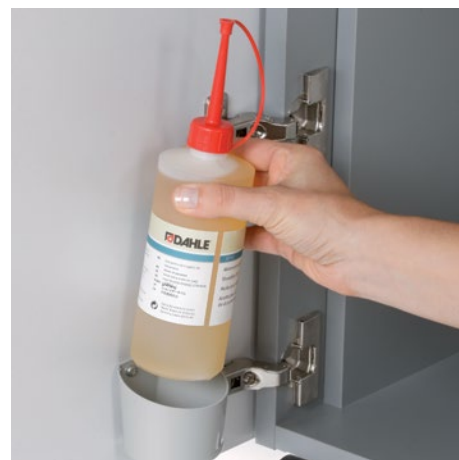
Przyjazny dla środowiska olej jest zawsze w zasięgu ręki, dołączony do wszystkich modeli produkujących śinki