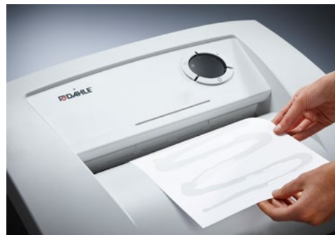
Niszczarka dokumentów Dahle Security 510 L plus