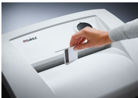
Niszczarka dokumentów Dahle Security 510 L plus