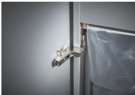
Niszczarka dokumentów Dahle Security 510 L plus