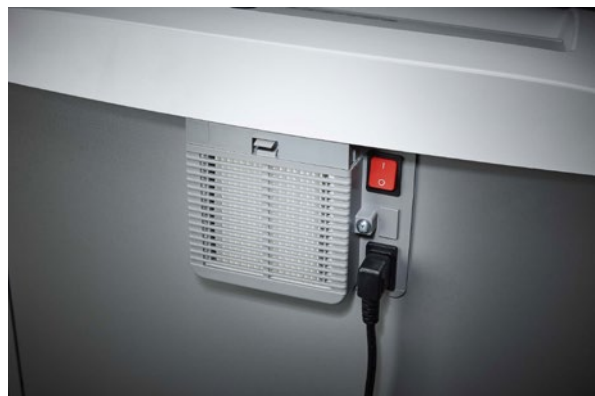
Niszczarka dokumentów Dahle Waste 204air