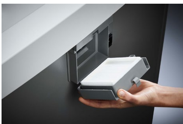
Niszczarka dokumentów Dahle Waste 204air