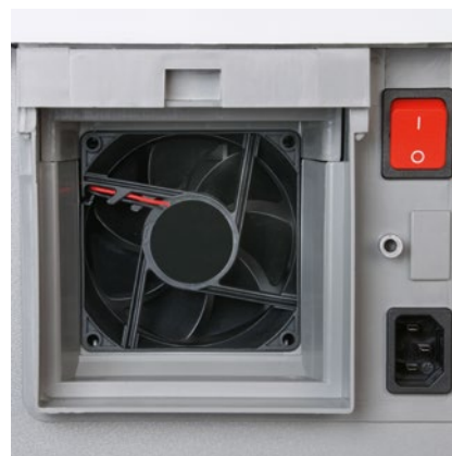
Wentylator zasysa mikropyłki w niszczarce i włacza je do filtra