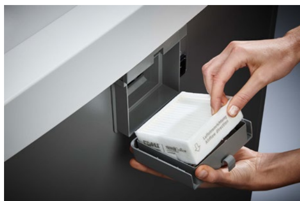
Niszczarka dokumentów Dahle Waste 204air