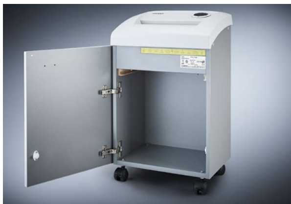
Niszczarka dokumentów Dahle Waste 204air