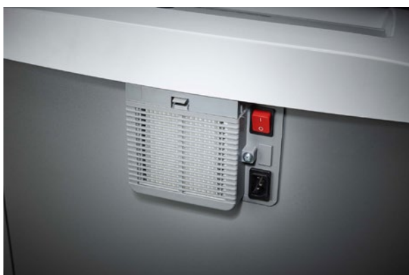
Niszczarka dokumentów Dahle Waste 204air