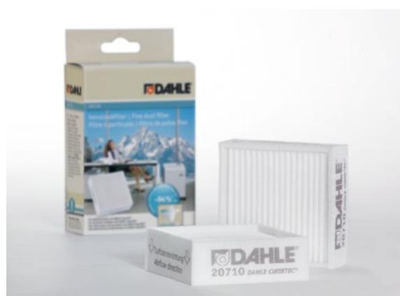
Filtr mikropyłków Dahle 20710