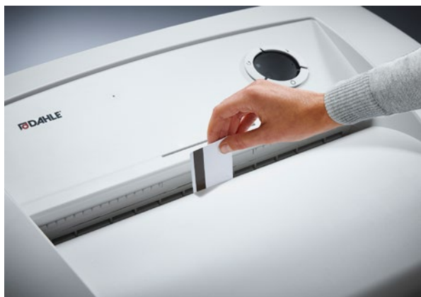
Dahle шредер Waste 216