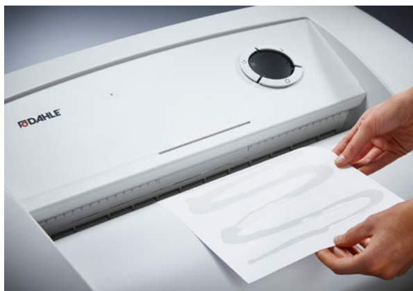
Dahle шредер Waste 216