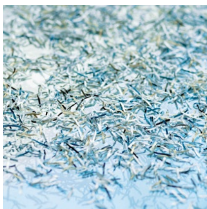
Poziom P-6: Rekomendowane na przykład dla nośników zawierających tajne dane wymagające zachowania nadzwyczajnych środków bezpieczeństwa